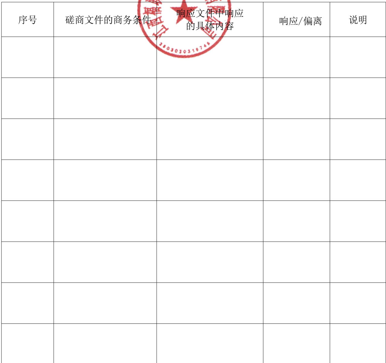
格式 6. 商务条件响应/偏离表

注： 1、供应商应当如实填写上表“响应文件中响应的具体内容”处内容，对采购文件提出的要求和条件作出明确响应，并列明具体响应数值或内容，只注明符合、满足等无具体内容表述的，所产生的一切后果由供应商承担。供应商需要说明的内容若需特殊表达，应先在本表中进行相应说明，再另页应答。