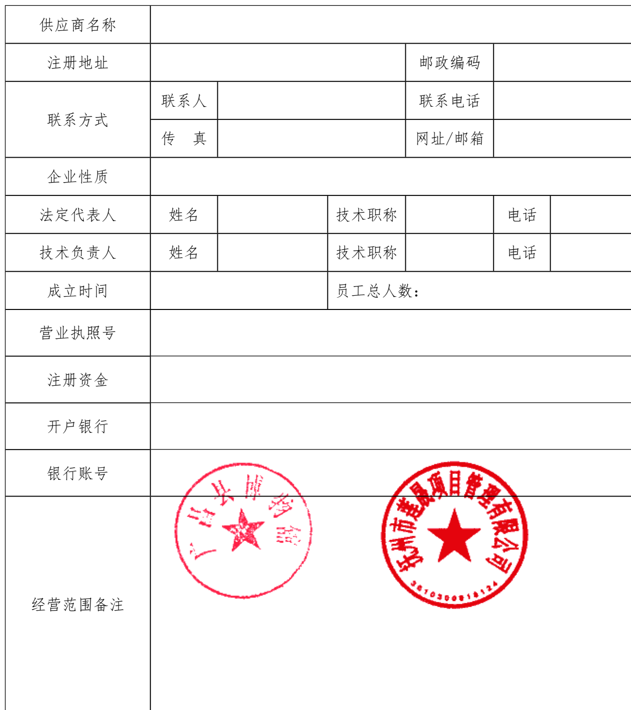
格式 10-1. 供应商情况一览表