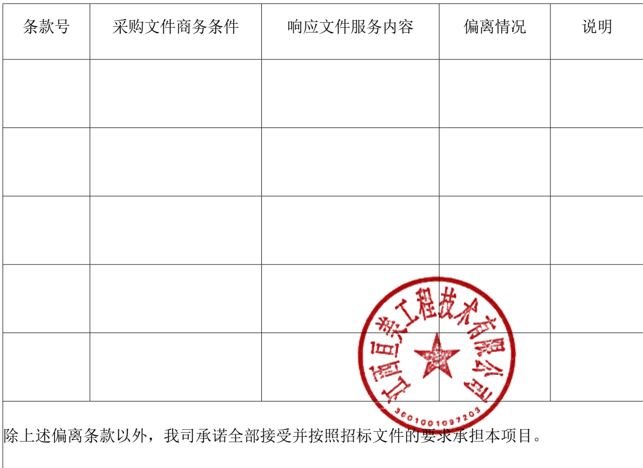
格式 6. 商务条件响应/偏离表