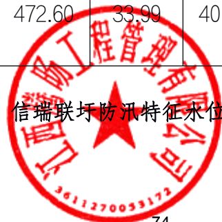
信瑞联圩防汛特征水位表