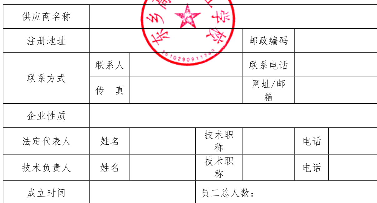
格式 10-1. 供应商情况一览表